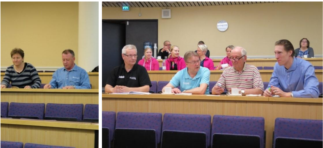
Kuvissa pilotin lajeille ja seuroille yhteisen tapaamisen (la 9.5.2015) osallistujia.

Yhteinen pilottimme oli kokonaisuutena onnistunut. Lämmin Kiitos siitä kuuluu Teille arvoisat pilotissa mukana olleet Seurat ja Seuratoimijat!